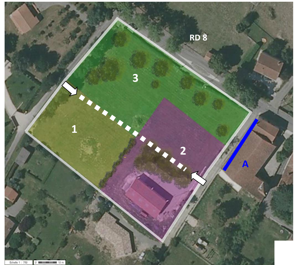
Les limites entre secteurs données à titre indicatif